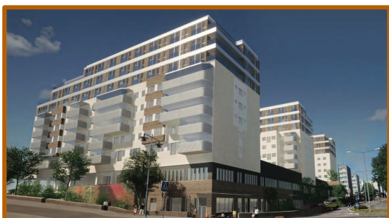
Illustration: Reppen Wartianinen arkitekter