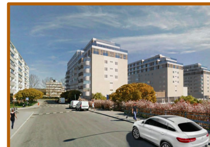
Illustration: Reppen Wartianinen arkitekter

Exakt hur det kommer se ut vet vi ju inte förens det är klart. Men vi har en vision om att det ska bli som på bilderna här nedanför och bredvid.